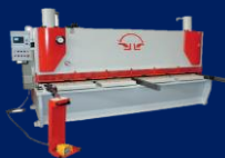
ماشین آلات صنعتی