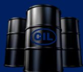
فراورده های پتروشیمی